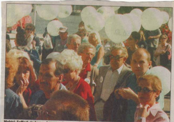
Malgré l'effort, la bonne humeur n'a pas quitté les participants sur les 2000 m du parcours.