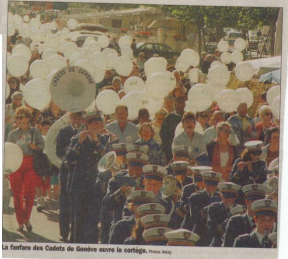
La fanfare des Cadets de Genève ouvre le cortège.