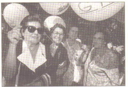
La marche vise à promouvoir l'idée d'une vieillesse active physiquement, mentalement et socialement.

Le lait de poule était tellement à la fête, hier après-midi sur les quais, que nous ne pouvions résister à l'envie de vous en donner la fameuse recette. A consommer sans modération... ► Faire chauffer 3 dl de lait (de vache) sans le faire bouillir. ► Ajouter ensuite un œuf entier et du sucre, en fouettant vigoureusement le mélange. ► Aromatiser selon les goûts (café, chocolat, cognac, rhum, kirsch, etc.), et servir la potion magique chaude ou froide. Santé! A. B.