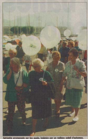
Agréable promenade sur les quais, baignés par un radieux soleil d'automne.

«... à vieillir est une fatalité, l'exercice physique assure une assurance... Les quelque mille personnes qui ont défilé sur les quais, hier après-midi à l'occasion de la Journée internationale des aînés, ont adopté ce slogan...»